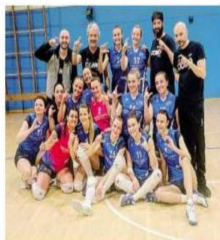
Testa della classifica per la Locanda dei Giurati Como Volley