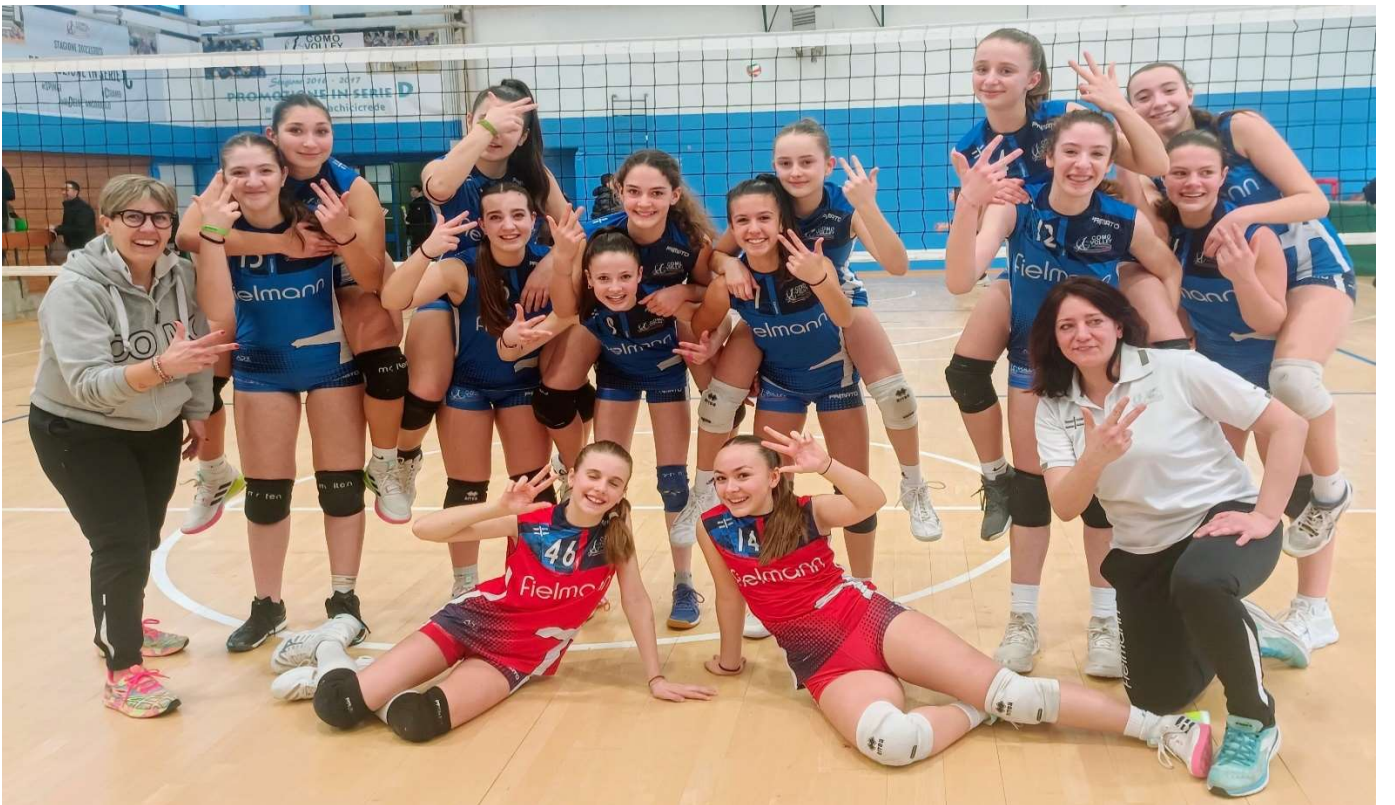
COMO VOLLEY Asd vs S. GIORGIO LURAGHESE - 3 - 2 (17-25 * 25-22 * 25-20 * 8-25 * 15-11)